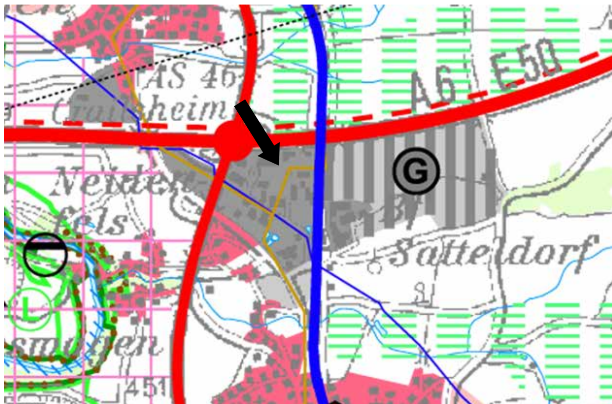
Bild 2: Regionalplan "Heilbronn-Franken 2020", Ausschnitt Gemeinde Satteldorf, 1:20.000