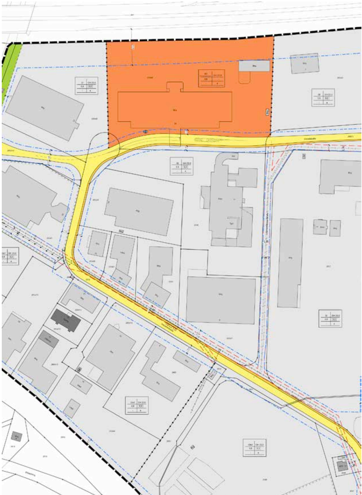
Bild 1: Teilausschnitt Bebauungsplan „Industriegebiet Satteldorf, 4. Änderung ohne Maßstab