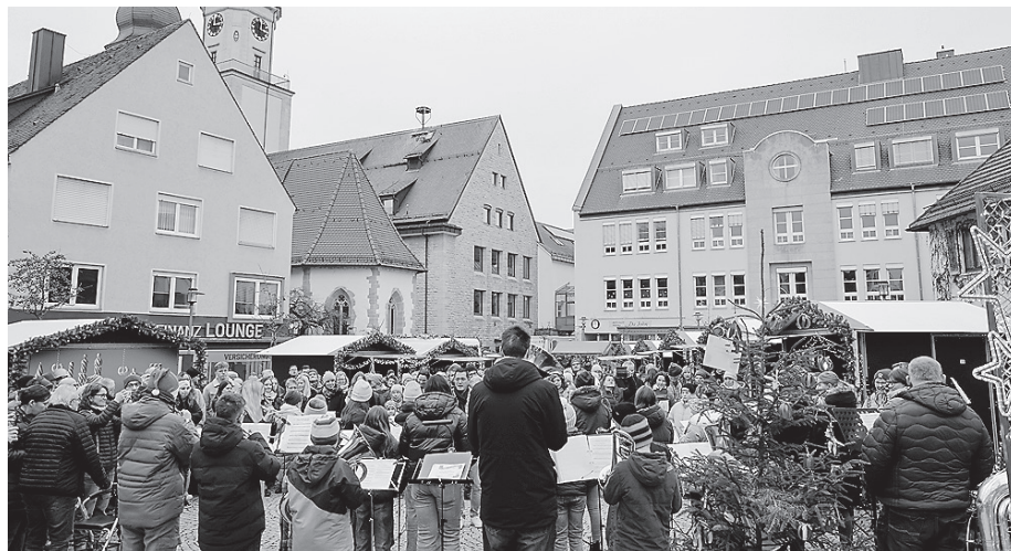
Sehr gut besucht waren die Programmpunkte am vergangenen Wochenende auf dem Weihnachtsmarkt. Am 4. Advent lädt die Stadtkapelle zu ihrem Weihnachtskonzert auf dem Marktplatz ein.