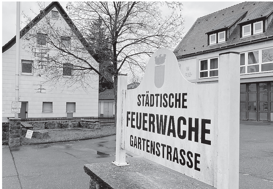
Die Nummer 18 wird abgerissen, die frei gewordene Fläche nutzt vorerst die Freiwillige Feuerwehr zum Parken.

Da in diesem Bereich mittelfristig eine städtebauliche Neuordnung vorgesehen ist, wird die frei werdende Fläche