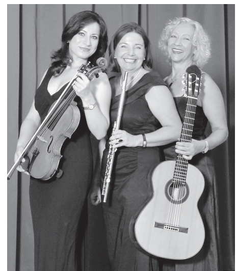
Das Ensemble Trio con Brio bestreitet das dritte Konzert der Konzertreihe für die Saison 2025/2026 am Sonntag, 11. Januar, um 19.30 Uhr im Ratssaal.

„Trio con Brio“ hat sich als feste Größe in der internationalen Musikwelt etabliert und ist für seine außergewöhnlichen Programme sowie für zahlreiche Auftritte bei renommierten Festivals, Rundfunk- und Fernsehsendungen bekannt.