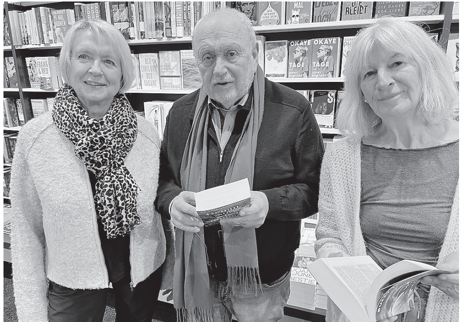
Das Team des „Kultur.Gut.“ gestaltet den städtischen Pop-up-Store in der Lange Straße künftig als offenen Kulturtreff für alle Generationen.

Gemeinsam verfolgen sie ein klares Ziel, das sie so formulieren: „Mit unserem Kulturtreff ‚Kultur.Gut.‘ wollen wir einen Beitrag zur Steigerung der Aufenthaltsqualität der Innenstadt leisten,