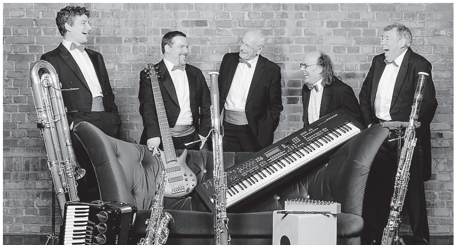
Das SWR Swing Fagottett bestreitet das diesjährige Silvesterkonzert für die Saison 2025/2026 am Mittwoch, 31. Dezember, um 17.00 Uhr im Ratssaal.

Das Konzert in Crailsheim wird durch eine witzige und informative Moderation ergänzt, die die Zuhörer auf eine