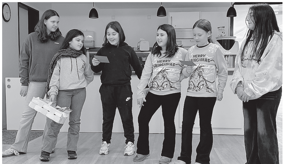
Sechs Mädchen auf guter Mission: Die Gute-Tat-AG des LMG in Aktion im Wolfgangstift.

An zwei Dienstagen machten sich die Mädchen persönlich auf den Weg ins Wolfgangstift, um nicht nur ihren Kalender zu überreichen, sondern auch einen Eindruck vom Alltag dort zu ge-