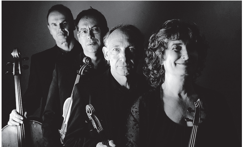
Am Freitag, 4. Oktober, findet ein Konzert des Hohenloher Streichquartetts in der Gottesackerkapelle statt.

Das Konzert findet am Freitag, 4. Oktober, um 19.00 Uhr statt und endet um 20.00 Uhr. Im Anschluss ist noch genügend Zeit, rechtzeitig zur Veranstaltung