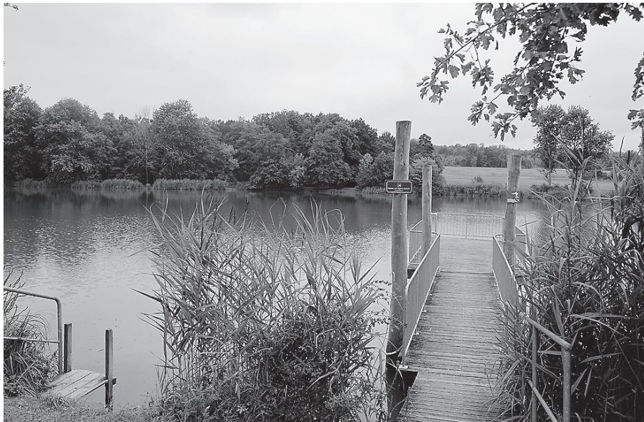
Der Degenbachsee lädt Sommer wie Winter zur Rast bei einer Wanderung ein.

Wer sich eine Abkühlung in der Mitte einer Wandertour gut vorstellen kann, der ist mit Horaffenweg 4 auf der richtigen Strecke unterwegs. Die Wanderbegeisterten müssen nur rund 77 Höhenmeter überwinden und die Route ist auch für Wanderanfänger geeignet, sie schlängelt sich vom Start- und Zielpunkt am Wanderparkplatz in Richtung Alexandersreut bis zum Degenbachsee und wieder zurück. Dieser Rundweg mit seinen 10,3 Kilometern ist in etwa 2:40 Stunden zu bewältigen. Er startet in Richtung Jagstheim über Wiesen und Felder durch ein winziges Naturschutzgebiet mit Wacholderheiden. Der Weg führt über den schmalen Degenbach bis nach Lohr, dort kann ein Abstecher zur Burg Lohr eingelegt wer-