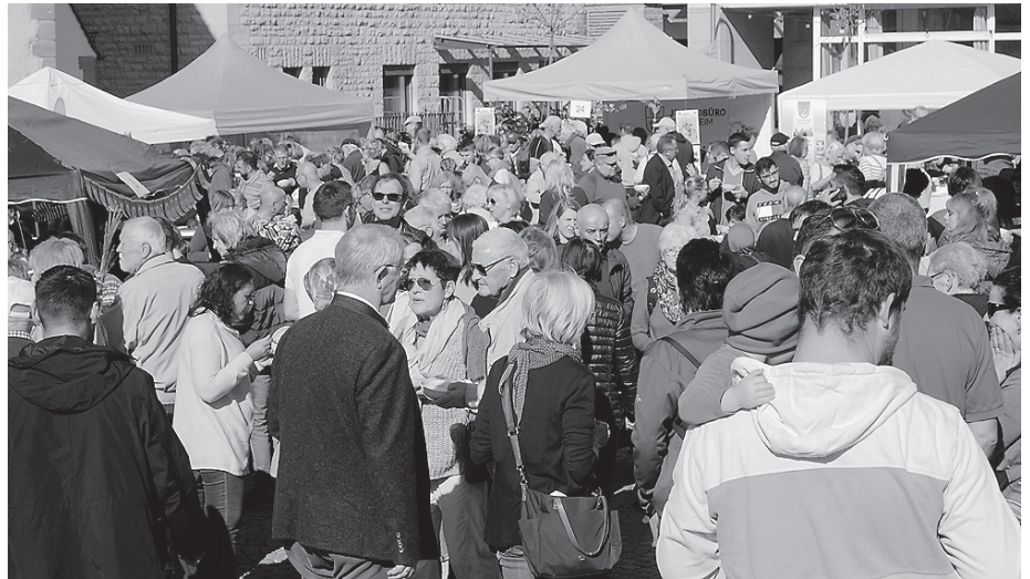
Suppenfest 2019: Gut gefüllter Schweinemarktplatz und strahlendes Wetter.

Für das 6. Internationale Crailsheimer Suppenfest sucht das Organisationsteam rund um vhs, Sachgebiet Zuwanderung & Integration der Stadt, Familienbildungsstätte, Kolping und Caritas weitere Köchinnen und Köche, die am Samstag, 12. Oktober, um die Mittagszeit mitmachen und ihre Lieblingssuppe kochen. Schon eingegangen sind unter anderem eine Kartoffelsuppe, eine ungarische Gulaschsuppe, ein Eintopf mit Hackbällchen, eine Suppe aus Tansania mit Kidneybohnen, Tomaten und Kokosmilch, und ein Cheddar-Mettpopf. Eine kleine Entschädigung für die Kosten kann auf Anfrage gern ausbezahlt werden. Auch Helferinnen und Helfer für Kasse und Spülmobil werden noch gesucht.