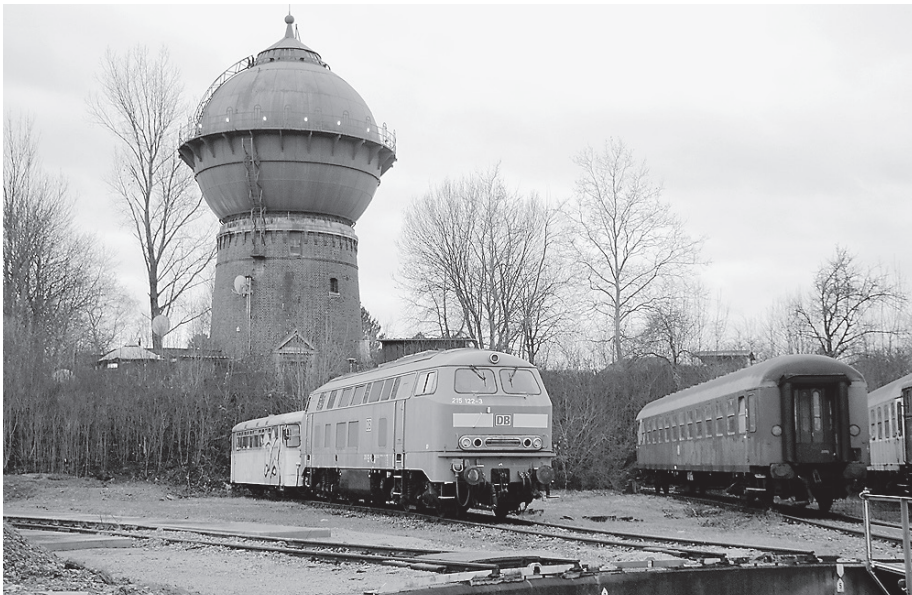
Es kann bei der fünften Etappe der Horaffenwege ein Blick auf den Wasserturm sowie das Bahnbetriebswerk erhascht werden.

Nach einer kurzen Rast geht es weiter in Richtung Burgberg. Auf dem Weg wird die Maulach gequert sowie das kleine Aspenbächle, welches in die Maulach mündet. Die Route führt weiter in und am Wald entlang. Wem die drei Stunden Wanderung noch nicht genügen, kann auch einen Abstecher zum Burgberg machen, die Gaststätte hat an Wochenenden und Feiertagen geöffnet. Nach dem Kurzaufenthalt, der sich allein des Ausblicks wegen schon lohnt, geht es weiter an zwei kleineren Seen vorbei, die sich ebenfalls für eine kurze Pause anbieten. Auf dem Rückweg lohnt es sich, einen Abstecher im Freibad „Maulachtal“ einzulegen, um sich bei sommerlichen Temperaturen abzukühlen. Von dort aus geht es wieder zurück zum Ausgangspunkt.