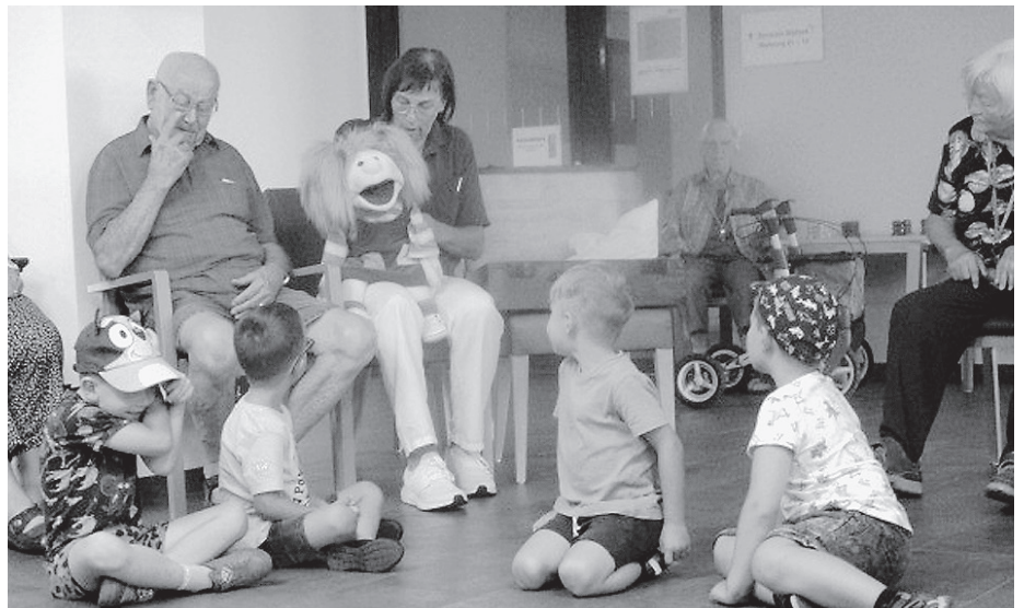
Die Bewohnerinnen und Bewohner des Wolfgangstifts freuen sich auf den monatlich stattfindenden Morgenkreis mit den Kindern des Kindergartens Lummerland.

Als die Kinder ihren Platz im Kreis gefunden hatten, konnte es losgehen. Die Leiterin des Seniorinnenmorgenkreises begrüßte alle mit einer Handpuppe namens Lucy. Dann waren die Kinder an der Reihe. Mit einem Begrüßungslied starteten sie. Anschließend kam, mit einem Klatschreim, Bewegung in