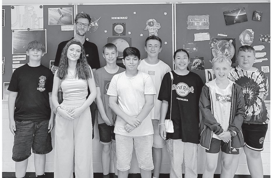
Schülerinnen und Schüler der Realschule am Karlsberg haben einen spannenden Audioguide zum Crailsheimer Planetenweg verfasst.

Über QR-Codes, die an den Informationstafeln zu den Planeten angebracht sind, können die etwa dreiminütigen Informationstexte mit dem Smartphone abgerufen und abgespielt werden. Die Texte enthalten grundlegende Informationen, spannende Fakten und Schätzfragen zu den einzelnen Plane-