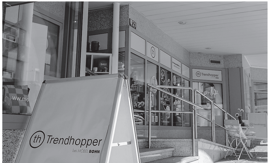
Hier im Pop-up-Store in der Langen Straße 21 geht es am 1. Oktober um Schmuck.

Am Dienstag, 1. Oktober 2024, verwandelt sich der Trendhopper Pop-up-Store