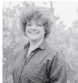
Dozentin Jessica Bisetto

Hohe Belastbarkeit, Flexibilität, Nerven wie Drahtseile, Kreativität und möglichst auch noch Superkräfte - die Anforderungen in Beruf und oft auch im Privaten sind enorm hoch.