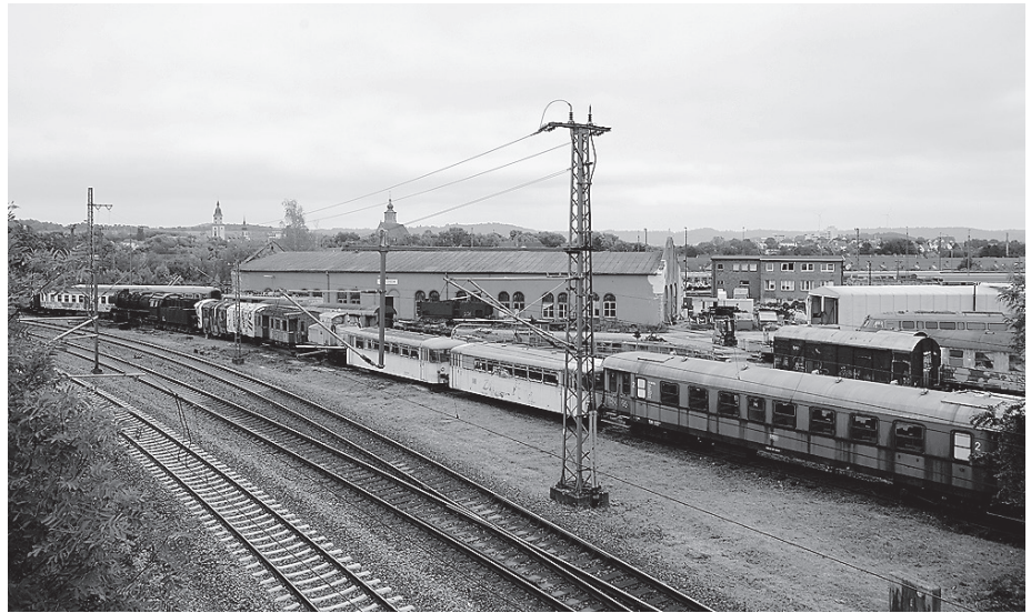
Wer bahnbegeistert ist, dem sei Horaffenweg fünf ans Herz gelegt.

Belohnt mit einem einzigartigen Blick über das verträumte Speltachtal werden all diejenigen, die sich auf den sechsten der insgesamt zehn Horaffenwege machen. Dieser findet seinen Ausgangspunkt am Ortsrand von Altenmünster in Richtung Onolzheim. Beim Start der knapp zehn kilometerlangen Wanderung geht es in Richtung Jagstheim. Nach einer Überquerung der ruhig fließenden Maulach führt der Weg leicht bergauf, zunächst am Waldrand entlang und später in den lichtdurchfluteten Wald hinein. Von oben ist es Zeit, den Blick über das idyllische Speltachtal schweifen zu lassen und den Talblick in Richtung Unterspeltach zu genießen. Das ist das absolute Highlight dieses Rundwegs. Auf dem Rückweg zum Startpunkt laden die Gaststätten in Onolzheim zur Einkehr ein. Bevor nach rund zweieinhalb Stunden der Ausgangspunkt wieder in Sicht ist.