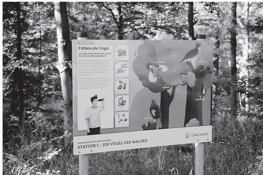
Auch der Naturerlebnispfad lässt sich auf dem vierten der Horaffenwege entdecken.

Auf dem Rückweg durch den Stadtteil Altenmünster, mit Blick auf eines der Wahrzeichen Crailsheims, den Wasserturm, führt der Weg an Gärten vorbei bis zum Sportgelände des ESV Crails-