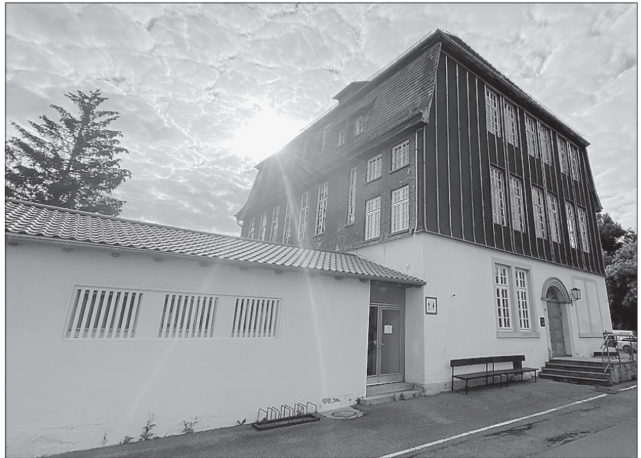
Die Toiletten des Jugendzentrums (Juze) sollen nicht mehr öffentlich sein.

Sozial- & Baubürgermeister Jörg Steuler erklärte zu Beginn der Beratung, dass der aktuelle Beschluss nur die formale Zustimmung zur Einleitung einer Prüfung von Alternativen darstelle und betonte, dass eine abschließende Lösung erst nach weiterer Prüfung erfolgen könne.