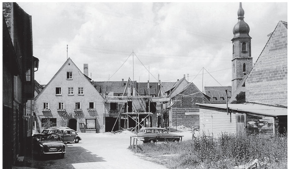
Unter anderem um den Wiederaufbau des Schweinemarktplatzes geht es in der Stadtführung am Mittwoch, 10. Juli.

Der Wiederaufbau der komplett zerstörten Crailsheimer Innenstadt nach 1945 war nicht nur eine Mammutaufgabe für Stadtplanung und Bauwirtschaft, er konfrontiert in seinen konkreten Gestaltungsgrundsätzen auch immer wieder mit der Frage, ob Crailsheim denn eine „schöne“ Stadt sei, ob der vorhandene Baubestand einen „Wert habe“ und ob hier eine Innenstadt mit hoher Aufenthaltsqualität überhaupt möglich sei. Die Führung zeigt die Grundprinzipien des Wiederaufbaus auf und diskutiert mit den Teil-