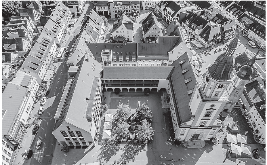
Alt und Neu fügen sich augenschmeichelnd zusammen: Das Rathaus aus der Vogelperspektive.

Bürgerinnen und Bürger haben somit die Möglichkeit, die vielfältigen Aufgaben und Projekte der städtischen Ressorts hautnah zu erleben – und Fragen zu stellen. Zur Verfügung stehen die Ressorts Verwaltung, Bildung & Wirtschaft, Digitales & Kommunikation sowie Soziales und Kultur mit Jugendbüro, den Städtepartnerschaften, der Musikschule und dem Stadtarchiv. Auch das Ressort Stadtentwicklung wird mit dabei sein und sich und vor allem Projekte am Info-Container auf dem Marktplatz präsentieren. Es gibt dort eine Diskussionsecke, dazu Vorführungen der Vermessungsdrohne und der Messgeräte, die Einblicke in moderne Stadtvermessungstechniken geben. Eine städtebauliche Führung vermittelt Wissenswertes über die Stadtentwicklung und Besucherinnen und Besucher sollen interaktiv eingebunden werden.