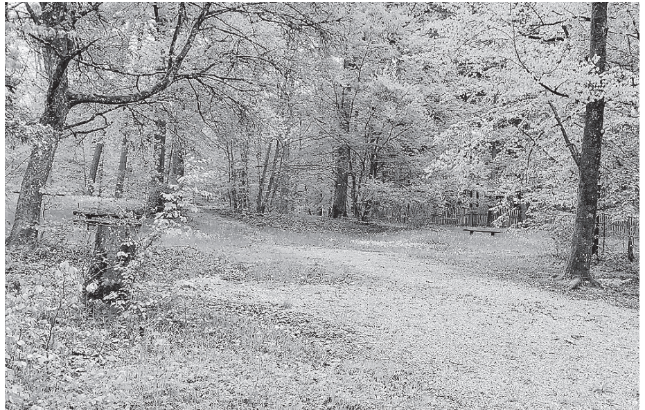
Auf dem Gelände der Stadtranderholung entsteht nach dem Naturkindergarten in Beuerlbach im kommenden Jahr der Waldkindergarten.

Der Naturkindergarten Grashüpfer wird neben dem Bürgerhaus in Beuerlbach entstehen. Als Wetterschutzraum dient das angrenzende Bürgerhaus, und für die Wiesenfläche wird ein Unterstand gebaut. Er startet zum 1. Mai 2025 mit zunächst 20 Kindern im Alter von drei bis sechs Jahren. Die Öffnungszeiten sind von 7.00 bis 14.00 Uhr geplant. Der Waldkindergarten Fuchsbau wird