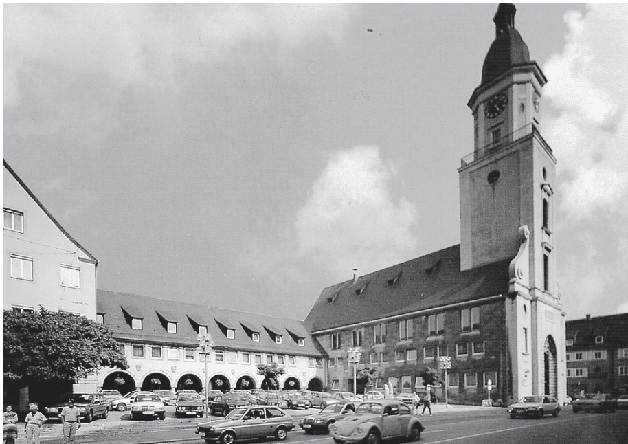
Um die Geschichte des Crailsheimer Rathauses geht es in einem Vortrag, der am Montag, 15. Juli, stattfindet. Auf dem Foto ist das Rathaus um 1985 zu sehen.

Info: Der Vortrag findet am Montag, 15. Juli, um 19.30 Uhr im Ratssaal des Rathauses statt. Der Eintritt liegt bei 5 Euro (Abendkasse), Mitglieder des Crailsheimer