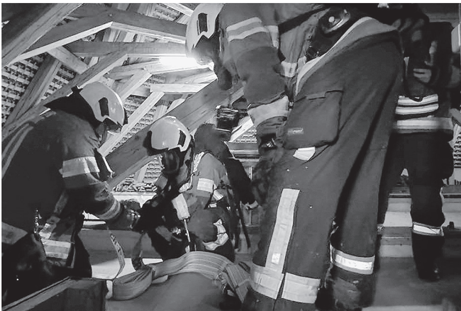
Viel Platz hatten die Retter nicht.

erschweren einen massiven Löschangriff. „In solchen historischen Gebäuden fehlen oft moderne Brandschutzkomponenten, was im Falle eines Brandes unsere Eingriffsmöglichkeiten stark limitiert“, betonte Klingenbeck. Die Leitung der Johannesgemeinde sei sich der Risiken bewusst und lege großen Wert auf die Wartung der elektrischen Anlagen und des Geläuts, um das Risiko eines Brandes zu minimieren. Die Übung zeigte deutlich, so resümierte der Feuerwehrkommandant, dass bei einem voll entwickelten Brand in der Johanneskirche die Einsatzmöglichkeiten begrenzt wären und der Erfolg maßgeblich von der schnellen Entdeckung und Bekämpfung des Feuers abhinge. Die Feuerwehr Crailsheim unterstreicht mit dieser Übung die Notwendigkeit, stets vorbereitet zu sein und die speziellen Herausforderungen historischer Bauten im Blick zu haben.