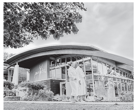
Nach der Revisionszeit ist die Crailsheimer Saunalandschaft parc vital ab Samstag, 6. Juli, um 10.00 Uhr wieder für die Gäste geöffnet.

den Wochenenden gilt der Basis-Tarif, der einen Besuch des parc vital ebenfalls ohne Zeitlimit für 23 Euro bzw. mit der Stadtwerke-Kundenkarte 20,70 Euro ermöglicht. Seit Ende letzten Jahres stehen Besitzern eines Elektroautos zudem zwei E-Ladeplätze auf dem Parkplatz des parc vital zur Verfügung. Das Fahrzeug kann hier mit einer Leistung von bis zu 22 kW während des Saunaaufenthalts geladen werden. Weitere Infos sind auf der Website der Saunalandschaft unter parc-vital.de zu finden.