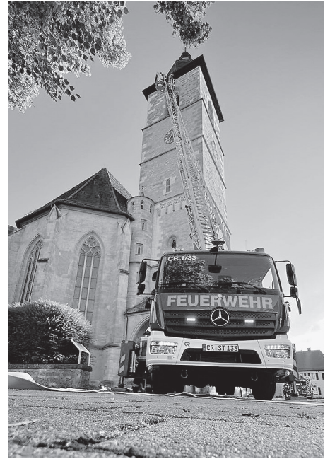
Bei der Übung ging es auch von außen an den Kirchturm ran.

Ein besonderes Problem stellt das massive Dachtragwerk der Kirche dar, welches für die Feuerwehr nur schwer zugänglich ist. Die beengten Durchgänge und die eingeschränkte Tragfähigkeit der Decken über dem Kirchenraum