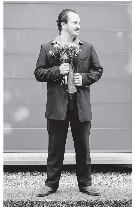
Gringo Mayer, ein echter Kurpfälzer, live zu erleben am Freitag ab 20.00 Uhr auf der Bühne im Spitalpark.

Info: Das komplette Programm findet sich unter www.kulturwochenende-crailsheim.de . Die gedruckten Flyer sind im Bürgerbüro und in den Geschäften der Innenstadt erhältlich.