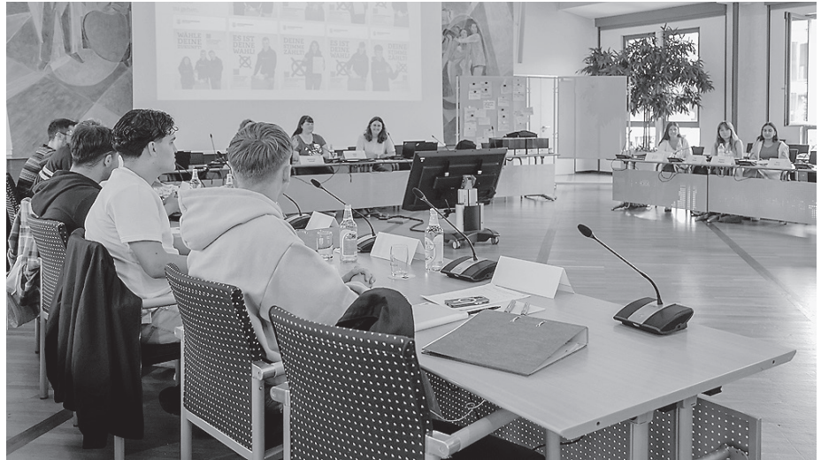
Das Ressort Digitales & Kommunikation informierte über seine Aufgaben und wie der JGR diese für sich nutzen kann.