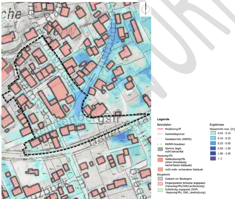
Abbildung 3: Starkregengefährdeter Bereich – Stadt Crailsheim, 2021.

Gemäß Starkregengefahrenkarten können im Bereich des Bebauungsplanes Überflutungen durch Starkregen auftreten. Dabei kann es in einigen Bereichen des Bebauungsplanes bei extremen Starkregenereignissen zu Überflutungstiefen von bis zu 50 cm und Fließgeschwindigkeiten von 5 m/s kommen. Die Starkregengefahrenkarte zeigt, dass am nördlichen Rand des Ortsteils Roßfeld starke Überflutungen vor allem im Bereich der (ggf. verlegten) Verdolungen (z.B. Hofwiesenstraße, Hartbach) ab dem Gewerbegebiet, aber auch schon westlich bis ca. zum Friedhof auftreten. Es füllen sich insbesondere Senken an Gebäuden.