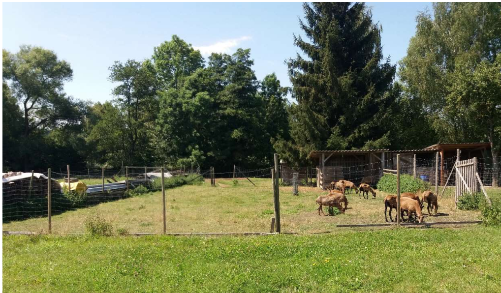
Abb. 3 -5: Blicke über das Plangebiet (Zentrum, Norden, Südwesten)