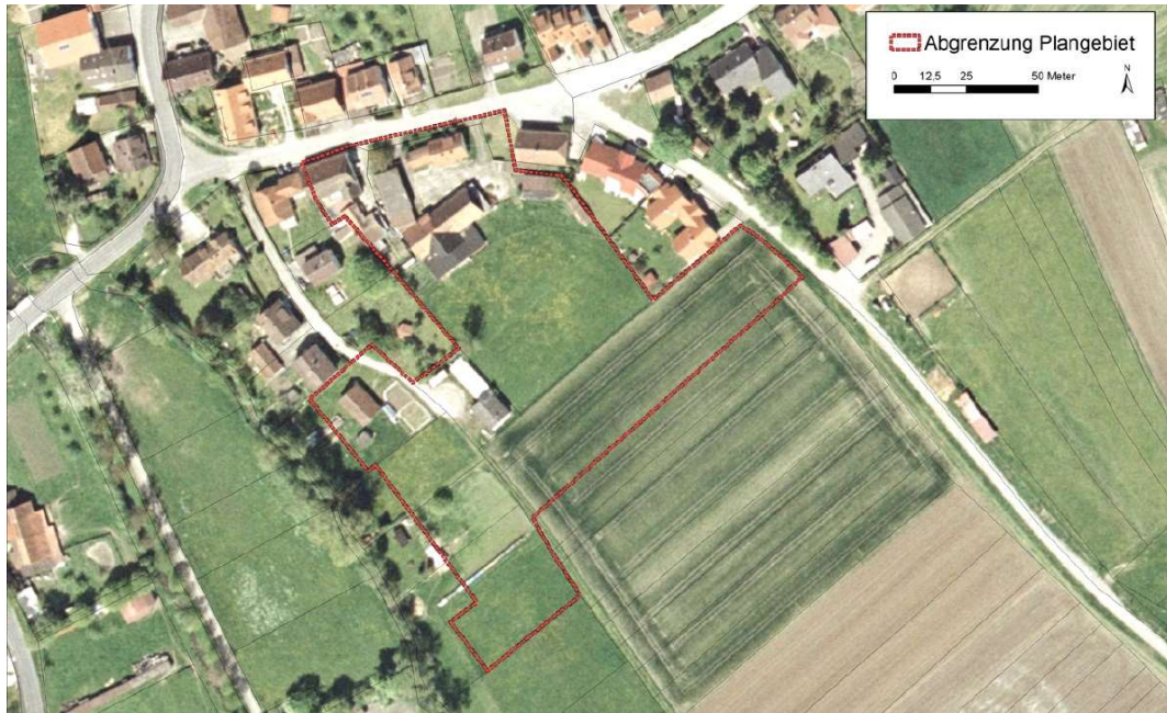
Abb. 2: Plangebiet (Kartengrundlage Luftbild, ein Teil der abgebildeten Gebäude existiert aktuell nicht mehr)

Das geplante Baugebiet liegt im Naturraum "Hohenloher Haller Ebene", einem Teil der Großlandschaft "Neckar- und Tauber Gäuplatten".