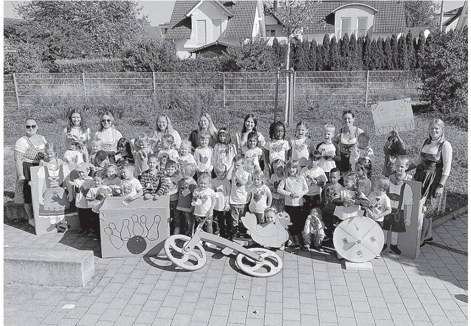
Die Safari-Kinder und ihre Betreuerinnen feierten stilecht mit Volksfest-Herzen und guter Laune.

Am Volksfestfreitag war es endlich so weit. Mit einem gemeinsamen Brezel-Frühstück stärkten sich alle für den Tag. Bei strahlendem Sonnenschein