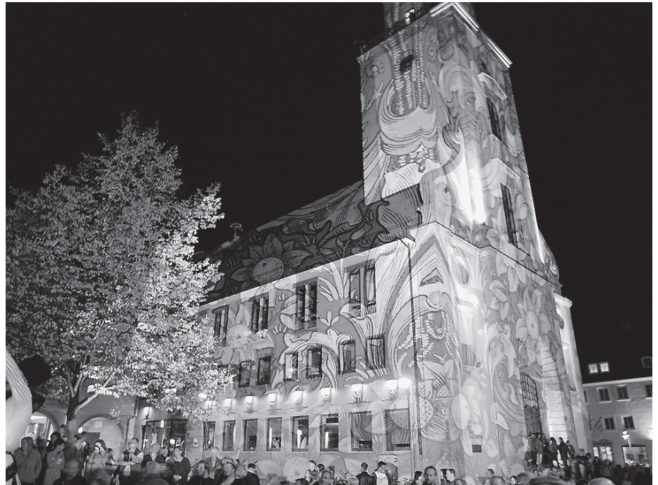
Das Rathaus und der Turm werden auch in diesem Jahr außergewöhnlich beleuchtet.

Neben den musikalischen und theatralischen Darbietungen gibt es auch visuelle Kunst zu entdecken: Im Stadtmuseum zeigt die Künstlerin Ulrike