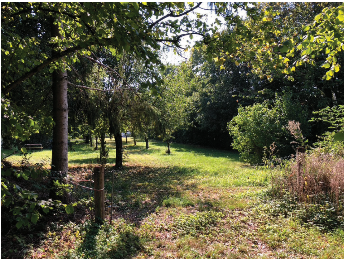
Abb. 7: Obstbaumbestand mit mittelhochstämmigen Obstbäumen