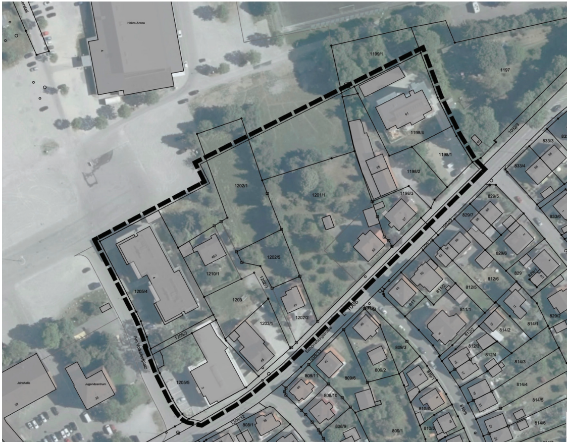
Abb. 2: Bebauungsplan Nr. A-2020-3B "Am Schönebürgstadion II" Abgrenzungsplan (zur Verfügung gestellt von der Stadtverwaltung Crailsheim, Planstand 31.07.2020)