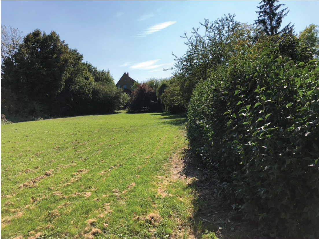
Abb. 8: Fettwiese mittlerer Standorte und Fliederhecke