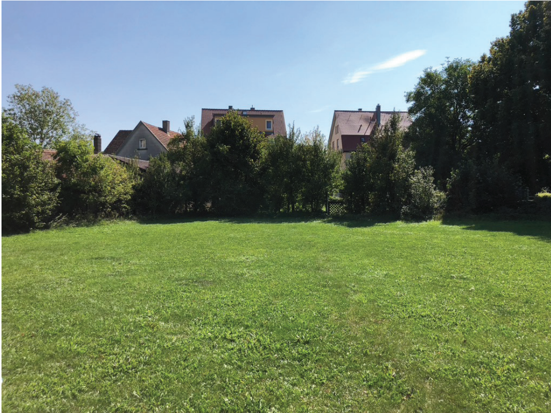
Abb. 6: Fettwiese mittlerer Standorte