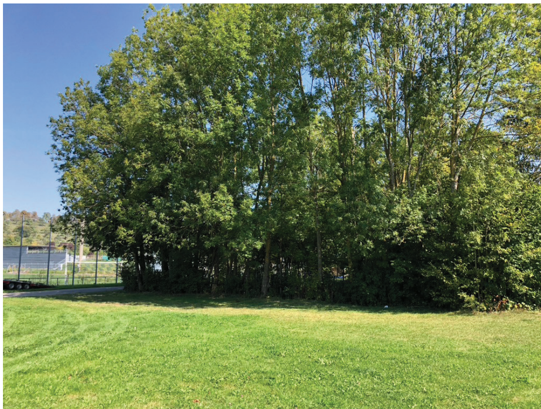
Abb. 5: Gehölzreihe