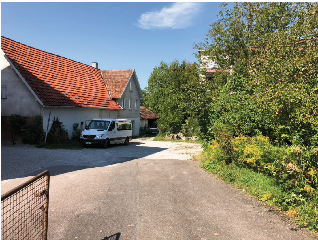
Abb. 11: älterer Gebäudebestand mit Holzscheune