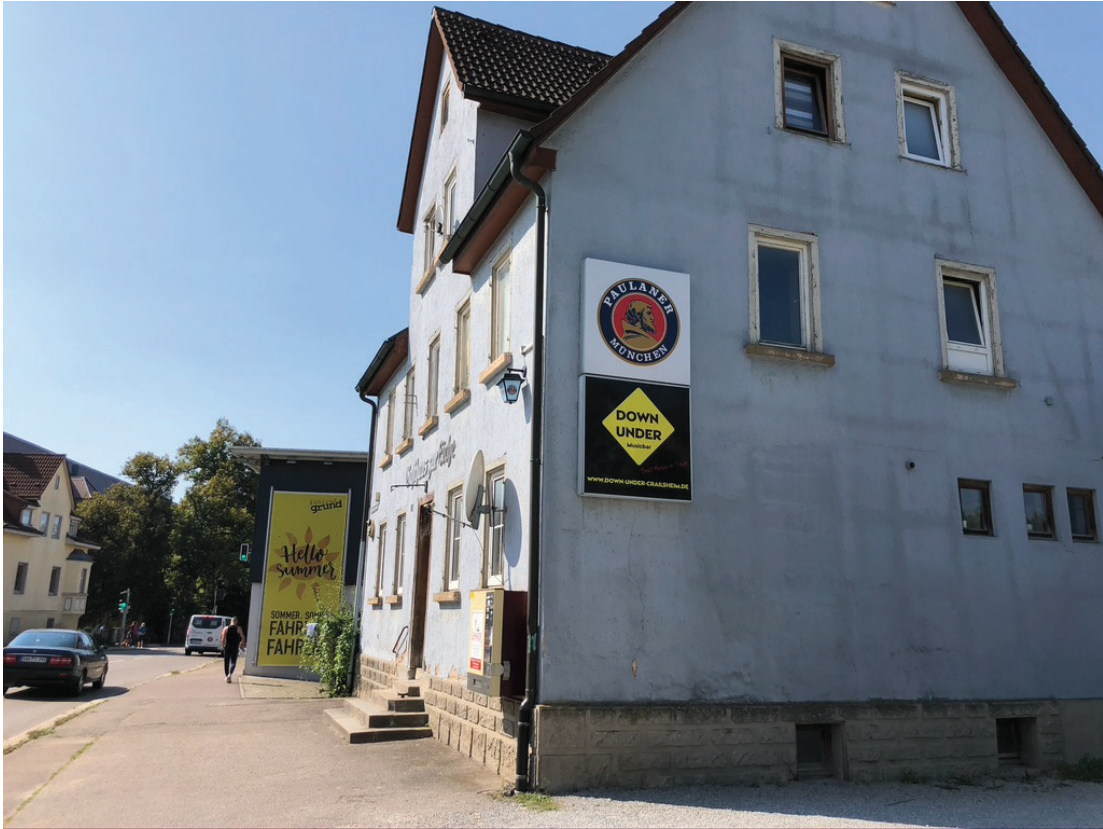
Abb. 10: Gebäude an der Schönebürgstraße