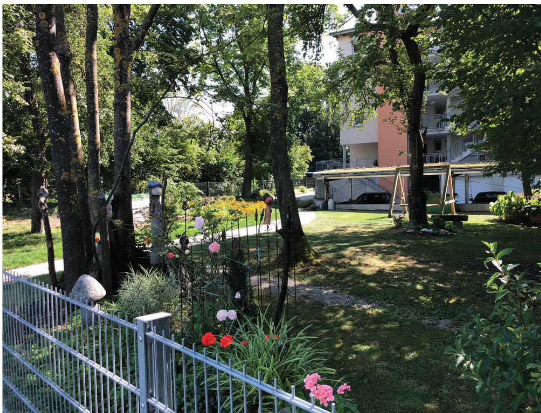
Abb. 4: Hausgarten