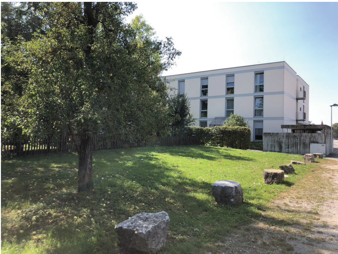
Abb. 9: Fettwiese mittlerer Standorte und Neubau