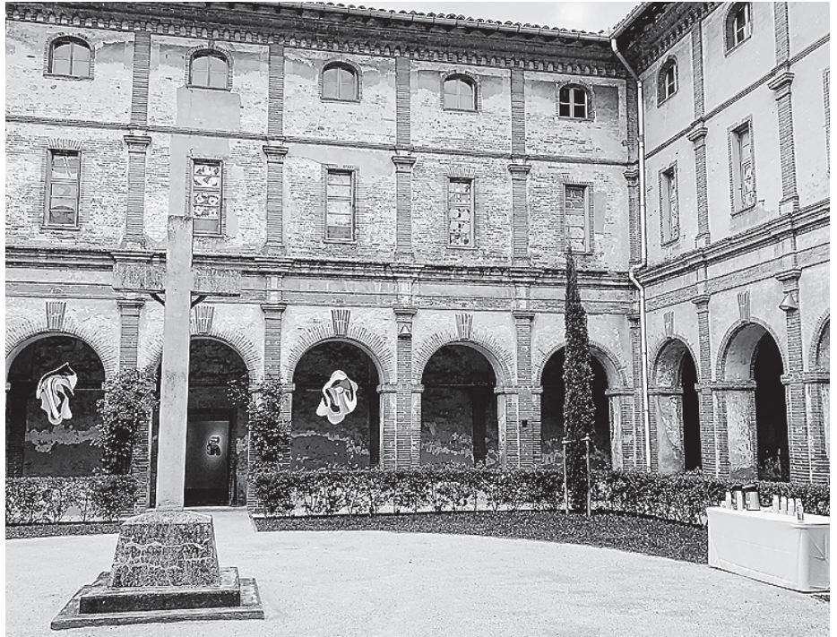
Deutsch-französische Freundschaft seit 1969 – die Partnerschaft zwischen Crailsheim und Pamiers wird bis heute aktiv gelebt.

Mit der französischen Stadt Pamiers im Département Ariège verbindet Crailsheim seit 1969 eine enge Partnerschaft. Erste Kontakte wurden bereits 1966 durch das Albert-Schweitzer-Gymnasium und die Musikschule in Pamiers geknüpft. Heute sind Schüleraustausche zwischen den Gymnasien und weiteren Schulen beider Städte ein fester Bestandteil, an denen regelmäßig bis zu 100 Jugendliche teilnehmen. Auch auf sportlicher Ebene gibt es eine lebendige Zusammenarbeit: Die Sportverbände beider Städte organisieren jährlich gemeinsame Trainingsaufenthalte. So bleibt die deutsch-französische Freundschaft nicht nur auf dem Papier bestehen, sondern wird von Ge-