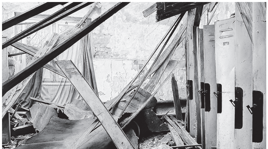
Stefan Bircheneder: „Oben ohne“, Acryl auf Leinwand

Bircheneders Werke faszinieren durch ihre irritierende Doppelwirkung: Was auf den ersten Blick wie großformatige Fotografie erscheint, ist in Wahrheit meisterhafte Malerei. Mit feinsten Lasurtechnik und Trompe-l'œil-Effekten auf Leinwand führt der Künstler das Auge des Betrachters in die Irre – und zugleich mitten hinein in die Atmosphäre verlassener Industriewelten. Neben den zweidimensionalen Bildern gestaltet Bircheneder auch raumgreifende Installationen: Schreibtische, Stühle oder gar ein Lastenaufzug, allesamt aus bemalter Leinwand, lassen die Grenzen zwischen Realität und Kunst verschwimmen.