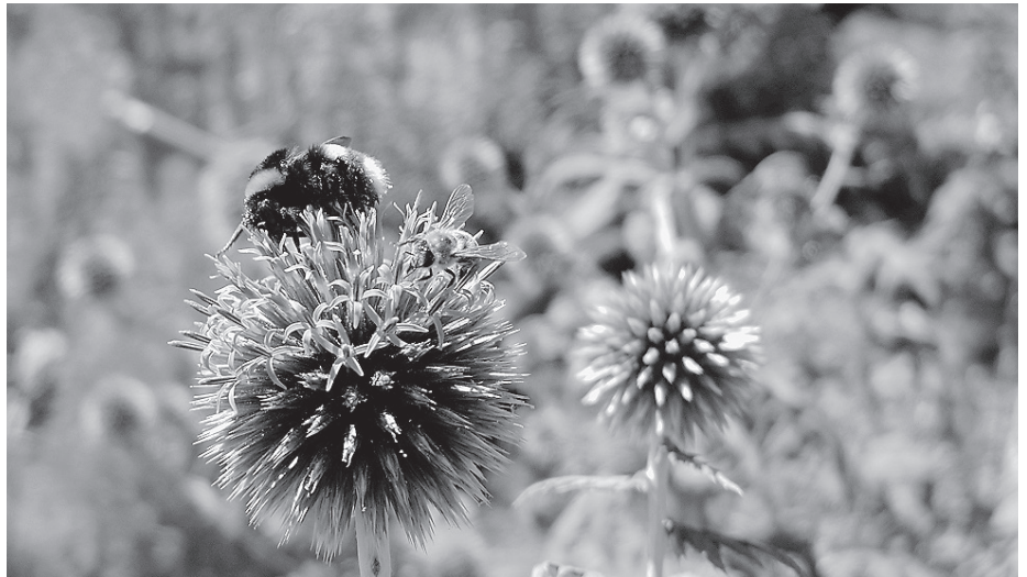
Schülerinnen und Schüler haben Crailsheims Natur im Bereich Hirtenwiesen und Fliegerhorst entdeckt.