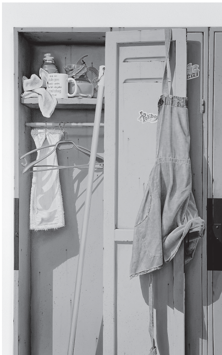
Stefan Bircheneder: „Spinde 22-24“, Ausschnitt, Öl, Acryl auf Leinwand

Info: Zur Vernissage am Freitag, 28. November, um 19.00 Uhr sind alle Interessierten herzlich eingeladen – der Künstler wird persönlich anwesend sein. Eine weitere Gelegenheit zur Begegnung bietet ein abendlicher Ausstellungsrundgang mit Stefan Bircheneder am Mittwoch, 17. Dezember, um 18.30 Uhr.