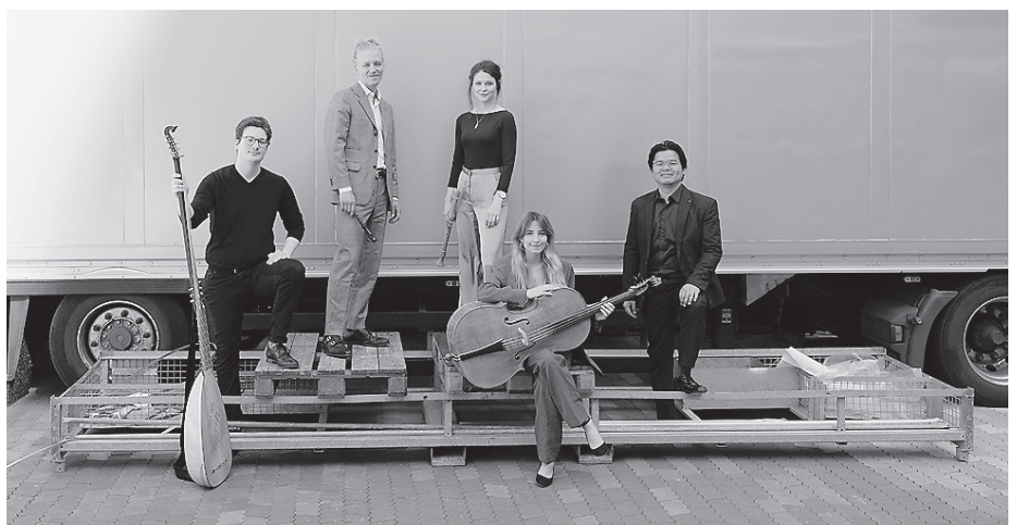
Das Ensemble „Interchange“ bestreitet das zweite Konzert der Konzertreihe für die Saison 2025/2026 am Sonntag, 30. November, um 19.30 Uhr im Ratssaal.

Mit ihrer überschäumenden Experimentierfreude und virtuellen Kreativität