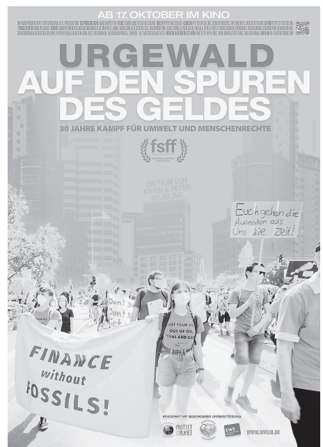
Der Dokumentarfilm über „urgewald“ wird am 23. November im Cinecity gezeigt.

Ab 10.30 Uhr gibt es ein kostenloses Getränk für die Besucherinnen und Besucher.