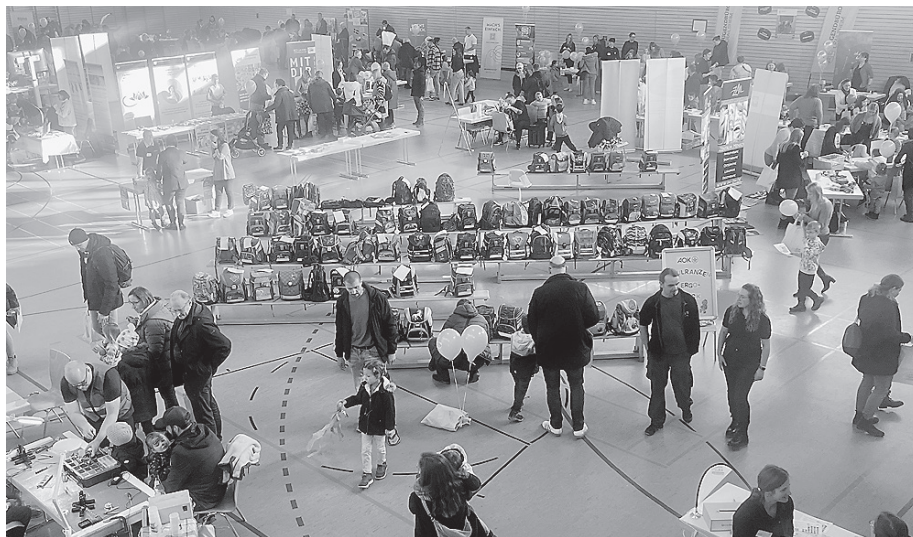
Die vergangene Ausgabe in der Hirtenwiesenhalle war gut besucht.

Ein Highlight wird erneut der Secondhand-Schulranzen-Basar sein, bei dem gut erhaltene Ranzen eine zweite Chance bekommen. Passend dazu bietet die AOK Heilbronn-Franken einen ergonomischen Check an, damit jedes Kind einen Schulranzen findet, der richtig sitzt.