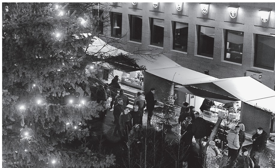
Der Crailsheimer Weihnachtsmarkt auf dem Marktplatz – ein vertrautes Bild, das in diesem Jahr wieder lebendig wird.

Die Besonderheit in diesem Jahr ist neben dem neuen Standort auch die Öffnungszeit. „Wir haben mit vereinten Kräften einige Händler und Weihnachtsmarktteilnehmer gewinnen können, die auch unter der Woche ihre Stände öffnen und insbesondere mit verschiedensten kulinarischen Angeboten locken“, zeigt sich Hinderberger zufrieden. So haben einige täglich geöffnet, andere bereits jeweils ab Donnerstag. Die Öffnungszeiten unter der Woche sind täglich von 14.00 bis 20.00 Uhr, an den Wochenenden bleibt alles beim Alten und der Weihnachtsmarkt öffnet samstags von 12.00 bis 22.00 Uhr und sonntags von 12.00 bis 20.00 Uhr. Die unter der Woche geöffneten Stände stehen allesamt auf dem Marktplatz und damit rund um die