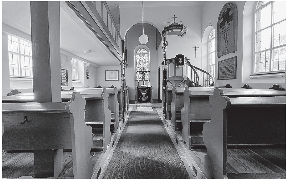
Kirche in Hornberg, 1873 unter Beteiligung der „Herren von Crailsheim“ erbaut.