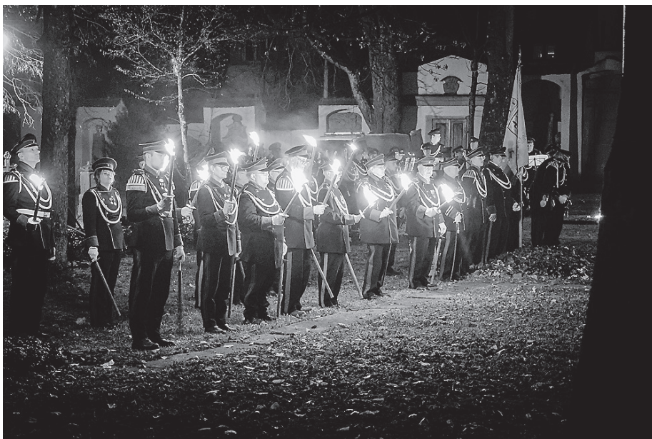
Die Bürgerwache stand mit Fackeln Ehrenwache.

Grimmer verwies auch auf das „aktuelle Friedensgutachten 2025, das von vier deutschen Friedensforschungsinstituten veröffentlicht wurde“ – ein Gutachten, das deutlich mache, warum Europa verbundene Strukturen braucht, um Sicherheit zu gewährleisten und gleichzeitig am Friedensziel festzuhalten. Mit Nachdruck appellierte er: „Lassen Sie uns gemeinsam für Frieden und Gerechtigkeit eintreten. Der Volkstrauertag ruft uns alle dazu auf, Verantwortung für den Frieden zu übernehmen.“ Der Oberbürgermeister hob Crailsheims besondere Rolle hervor: Als „tolerante und weltoffene Stadt mit 9.004 ausländischen Bewohnerinnen und Bewohnern aus 112 Nationen“ sei Crailsheim ein lebendiges Beispiel für friedliches Zusammenleben und demokratischen Respekt. Diese Werte seien „die Grundfesten unserer freiheitlich-demokratischen Gemeinschaft“.