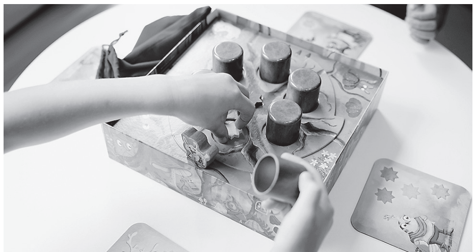
Beim Spielenachmittag der Stadtbücherei entdecken Kinder, Eltern und Großeltern gemeinsam neue Lieblingsspiele und verbringen einen fröhlichen Nachmittag in geselliger Runde.

Der Spielenachmittag bietet die perfekte Gelegenheit, Zeit miteinander zu