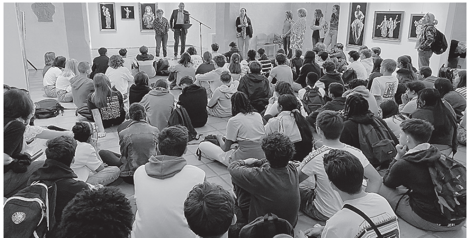
Schüleraustausch im vergangenen Jahr: die Gruppe aus Pamiers im Stadtmuseum.

Die Stadt Crailsheim wird vom 27. März bis zum 1. April zum Zentrum internationaler Begegnungen. Delegationen aus den Partnerstädten Pamiers (Frankreich), Jurbarkas (Litauen) und Biłgoraj (Polen) kommen zusammen, um die langjährigen Freundschaften zu feiern und zu vertiefen. Diese Partnerschaften, die teils seit Jahrzehnten bestehen, sind geprägt von intensivem bürgerschaftlichem Engagement und regelmäßigem