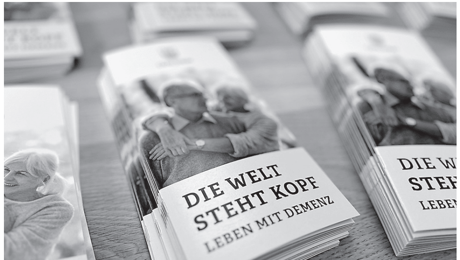
Die Flyer zur Veranstaltungsreihe liegen öffentlich aus.

Die Veranstaltung am Donnerstag, 27. Februar, von 15.30 bis 17.00 Uhr, im Gemeindehaus in der Kurt-Schumacher-Straße 3 richtet sich speziell an Menschen mit Demenz und ihre Angehörigen und bietet die Gelegenheit, durch Musik Erinnerungen zu wecken und in Kon-