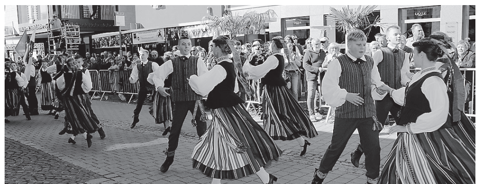
Folklore aus Jubarkas ist schon fast traditionell in Crailsheim während des Volksfestzuges.