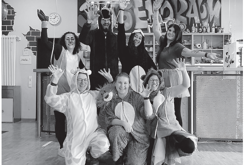
Der Kinderfasching des Jugendbüros findet am Rosenmontag, 3. März statt.

Weitere Infos gibt es unter Telefon 07951 95958-14 oder per E-Mail an jugendbuero@crailsheim.de.