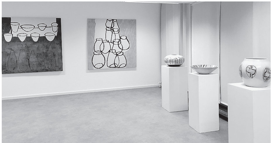
Ein Blick in die aktuelle Ausstellung im KulturWerk in Crailsheim.

Das KulturWerk ist ein temporäres Kulturzentrum mitten in Crailsheim und ist also vieles – auch eine Galerie. Derzeit ist dort eine Ausstellung zu sehen, die der Grafik vorbehalten ist. Ausgestellt sind Zeichnungen und Druckgrafiken von zwei renommierten Kunstschaffenden aus der Region: von Anne