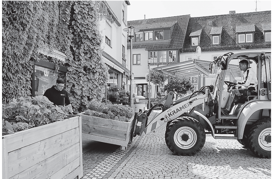
Die beiden Mitarbeiter des städtischen Baubetriebshofes, Christian Böttinger und Andreas Druckenmüller, haben die Hochbeete im Rahmen der Aktion „Essbare Stadt“ wieder aus ihrem Winterschlaf geholt.

Die Pflanzkästen sollen auf ganz simple Art und Weise für mehr Nachhaltigkeit und Biodiversität im städtischen Raum und auf öffentlichen Grünflächen sorgen. Obst und Gemüse, Kräuter, Salat, Rauke: All das steht kostenlos zur Verfügung, sobald die Pflanzen erntereif sind. In der vergangenen Woche, pünktlich nach dem kleinen Kälteeinbruch, wurden die Hochbeete aus dem Winterschlaf geholt und frisch