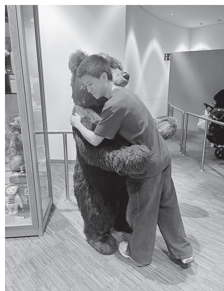
Im Steiff-Museum erhielt der Austauschschüler Einblicke, wie Teddybären hergestellt werden – inklusive einer großen Kuscheleinheit.

Wir haben als Familie viele Ausflüge gemacht. Ich war im Technik Museum und konnte sogar in eine Concorde hineingehen. Außerdem habe ich viele interessante Autos, Panzer und Fahrräder gesehen. Im Steiff Museum habe ich gelernt, wie Teddybären hergestellt werden, und mir einen kleinen Schlüsselanhänger gekauft.