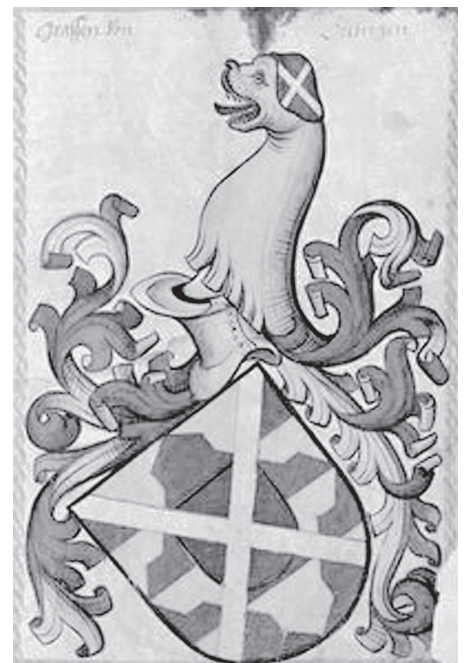
Das Wappen der Grafen von Oettingen verweist auf die mittelalterlichen Machtverhältnisse, die beim Vortrag über Crailsheim um 1300 näher beleuchtet werden.

Ratssaal des Rathauses statt. Die Gebühr liegt bei 5 Euro an der Abendkasse, Mitglieder des Crailsheimer Historischen Vereins sind frei. Eine Veranstaltung des Stadtarchivs Crailsheim und des Crailsheimer Historischen Vereins.