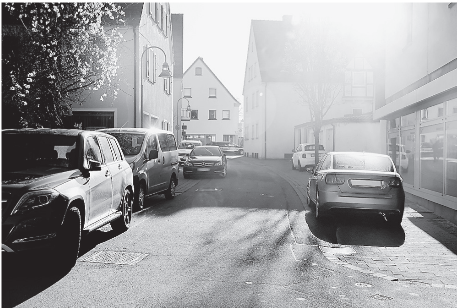
Falsch abgestellte Fahrzeuge in engen Straßen können die Sicht behindern, Verkehrswege blockieren und im Ernstfall Einsatzkräfte aufhalten.

Richtiges Parken heißt deshalb auch, bestimmte Bereiche konsequent freizuhalten. Dazu zählen Zebrastreifen und Fußgängerfurten, Geh- und Radwege, Kreuzungen und Einmündungen sowie, dass das Parken in zweiter Reihe vermieden wird. Regelkonformes Parken ist weit mehr als eine Frage möglicher Bußgelder. Es senkt Unfallrisiken, schützt schwächere Verkehrsteilnehmende und stellt sicher, dass Hilfe dort ankommt, wo sie gebraucht wird. Wer richtig parkt, sorgt mit dafür, dass die Straßen für alle sicher bleiben.