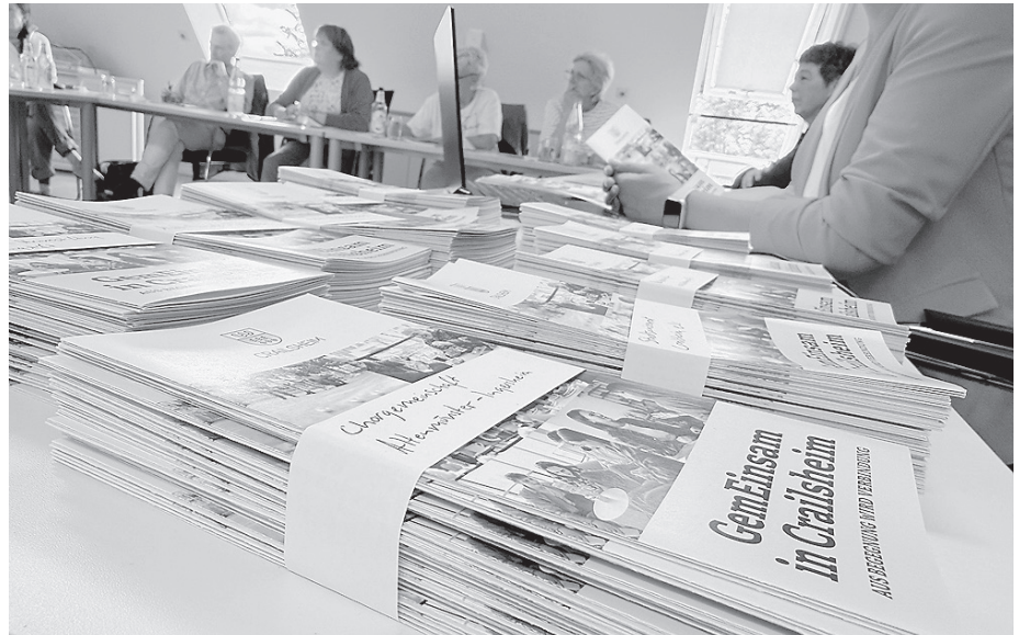
Diese Flyer liegen an vielen Orten aus, beispielsweise bei den beteiligten Institutionen, Ärzten oder Physiotherapeuten.

Künftig sollen all diese Angebote in einer landkreisweiten Datenbank gebündelt werden, um sie leichter auffindbar zu machen – auch für Multiplikatoren wie Pflegekräfte, Ärzte oder ehrenamtliche Helfer.