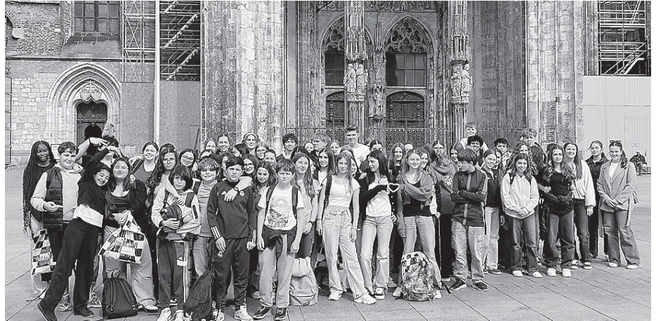
Eine Woche lang hatten Schülerinnen und Schüler des ASG Gäste aus Frankreich und erlebten mit ihnen eine eindrucksvolle Zeit.

Sportlich wurde es beim gemeinsamen Training in der Blue Box. Zwei Jugendtrainer der Crailsheim Merlins gestalte-