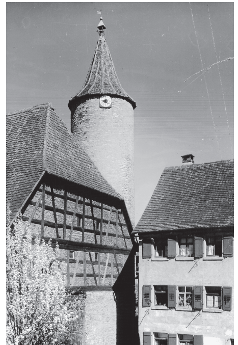
Auch der Diebsturm, der als Gefängnis auch im Rahmen der Crailsheimer Hexenprozesse eine Rolle spielte, wird im Film näher beleuchtet.

Info: Die „Crailsheimer Türme“ werden am Donnerstag, 25. April, um 19.30 Uhr im Ratssaal gezeigt. Der Eintritt ist frei. Alle Interessierten sind herzlich einge-