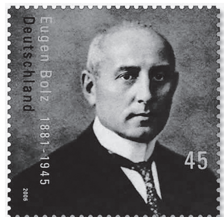
Um Eugen Bolz, einen der wichtigsten Politiker in Württemberg in der Zeit der Weimarer Republik, dreht sich der Vortrag, der am Montag, 29. April, stattfindet.

Info: Der Vortrag über den württembergischen Staatspräsidenten Eugen Bolz findet am Montag, 29. April, um 19.30 Uhr im Gemeindehaus St. Bonifatius, Beuerlbacher Straße 3, statt. Veranstalter ist die Katholische Erwachsenenbildung (keb) im Kreis Schwäbisch Hall in Kooperation mit der Katholi-