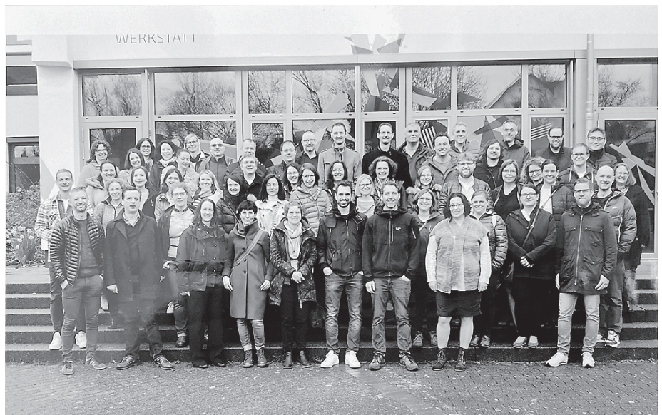
Silbernes Abitur – vor 25 Jahren hat der Abiturjahrgang 1999 seinen Abschluss abgelegt.