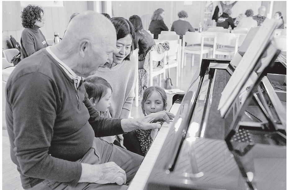
Musik kennt kein Alter: Die Premiere des Ethno Music Spring Camps in Crailsheim schlug mit einem überwältigenden Erfolg ein.

Egal ob Kinder, Jugendliche oder Erwachsene, alle sind herzlich willkommen. Sie werden die Gelegenheit haben, Lieder aus der Folkmusik verschiedener