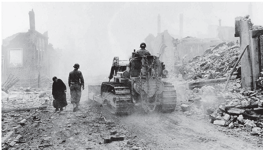
Am Vorabend des 79. Jahrestages der Zerstörung Crailsheims findet eine besondere Stadtführung statt.

Info: Die Stadtführung am Freitag, 19. April, startet um 18.00 Uhr auf dem