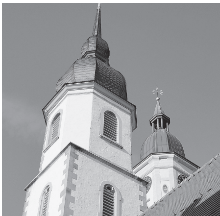
Um die drei Kapellen in der Crailsheimer Innenstadt dreht sich die Stadtführung am Sonntag, 21. April.

Info: Die Sonntagsführung zu den „drei Schönen“ Alt-Crailsheims findet am Sonntag, 21. April, um 11.00 Uhr statt. Der Treffpunkt ist auf dem Marktplatz. Die Teilnahmegebühr liegt bei 5 Euro.