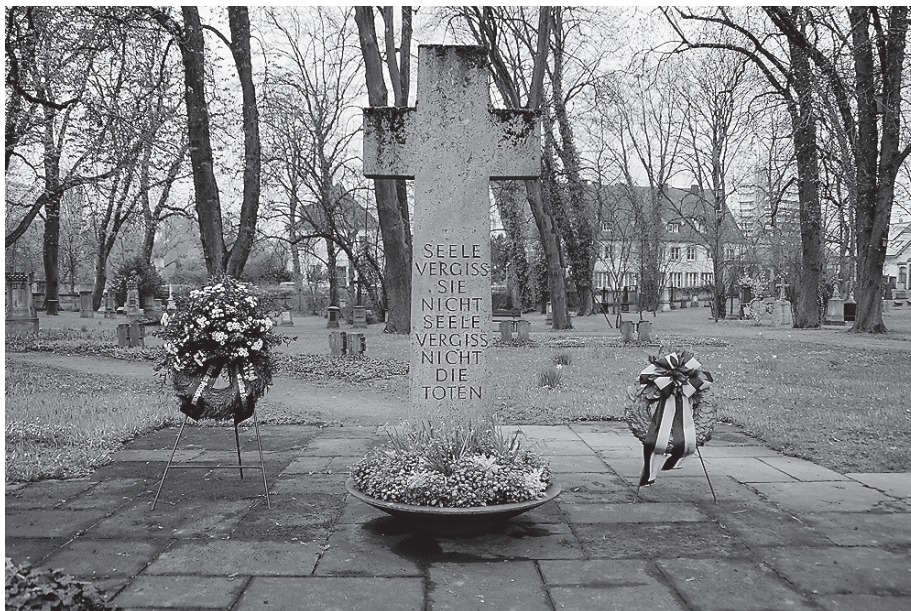
Am 20. April findet ein Gedenken mit Kranzniederlegung auf dem Ehrenfriedhof statt.

Das Gedenken soll neben der Erinnerung an das Schicksal unserer Heimat-