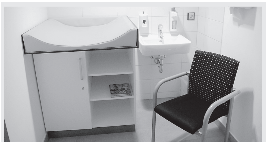
Für junge Eltern: Im Rathaus ist ein praktischer Wickelraum eingerichtet. Dieser befindet sich im ersten Stock des Hauptbaus im Übergang zum Arkadenbau und ist mit dem Fahrstuhl erreichbar.

laden. Eine Veranstaltung des Stadtarchivs Crailsheim, des Crailsheimer Historischen Vereins und des Film- und Videoclubs Crailsheim